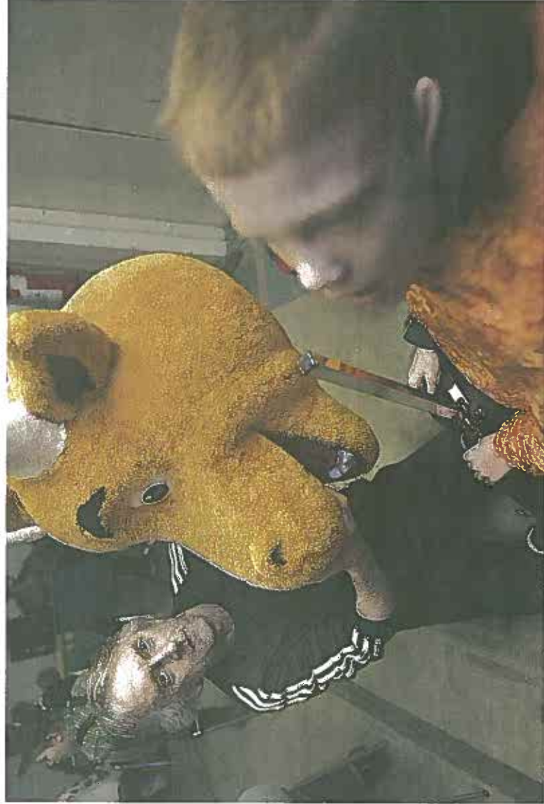
Teater er en god måde at udvikle sig og få selvillid på. Showet fra Vestermarks skolen er årets højdepunkt for elever, lærere og forældre.